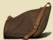
Jagdhorn Tasche Fürst-Pleß